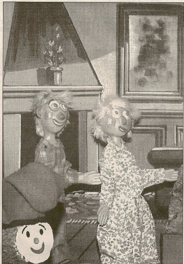
Un racó del decorat de «Nadales i caga-tió».

Ara fa dos anys van ocupar el Teatre Nacional de Catalunya